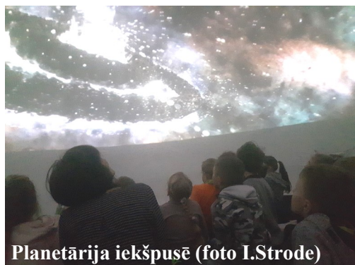
Planetārija iekšpusē

Degumnieku pamatskolā 2018./2019.m.g. tiek realizēts projekts "Veselības veicināšanas un slimību profilakses pasākumu īstenošana Madonas novada iedzīvotājiem" (9.2.42/16/I/092) Skolēniem projekta ietvaros ir iespēja darboties kopā ar fizioterapeitu, uztura speciālistu, psihoterapeitu- psihologu, kā arī ieklausīties sportistu un pirtnieku veiksmes stāstos.