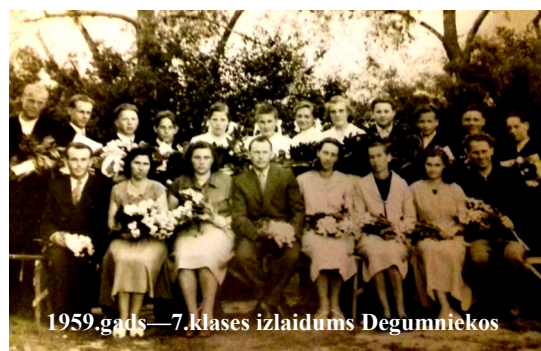
1959.gads—7.klases izlaidums Degumniekos

1959.gadā—7.klases izlaidums Degumniekos