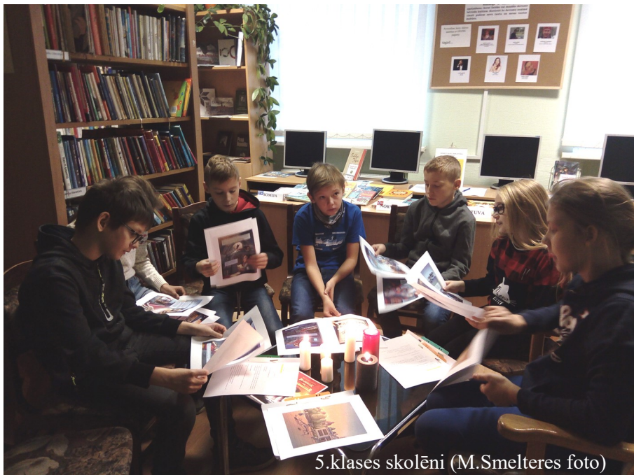
5.klases skolēni

Skolēni bibliotēkā darbojās ar lielu interesi, ar nopietnu attieksmi lasīja tekstu fragmentus par supervaroni Lisu un centās iejusties viņas situācijā, kā arī sa-